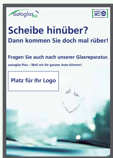
autoglas Plus Design Nr. 1 (Hochformat)