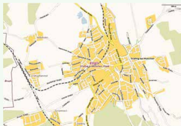
Beispiel Verteilgebiet Postwurfsendung