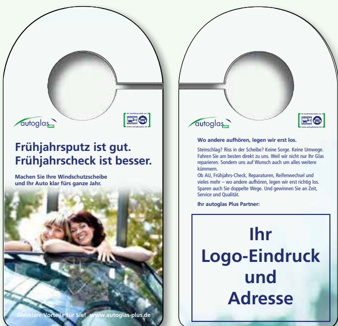
Design: autoglas Plus Frühling

Dezent und aufmerksamkeitsstark zugleich. Hinterlässt keine Spuren und prägt sich doch ein. Nutzen auch Sie den Spiegelhänger, um Ihre Kunden zu binden und für neue Aufträge zu gewinnen. Die Botschaft ist ebenso eindeutig wie klar: Wer zu Ihnen kommt, muss nirgendwo anders mehr hin. Auch bei Autoglas!