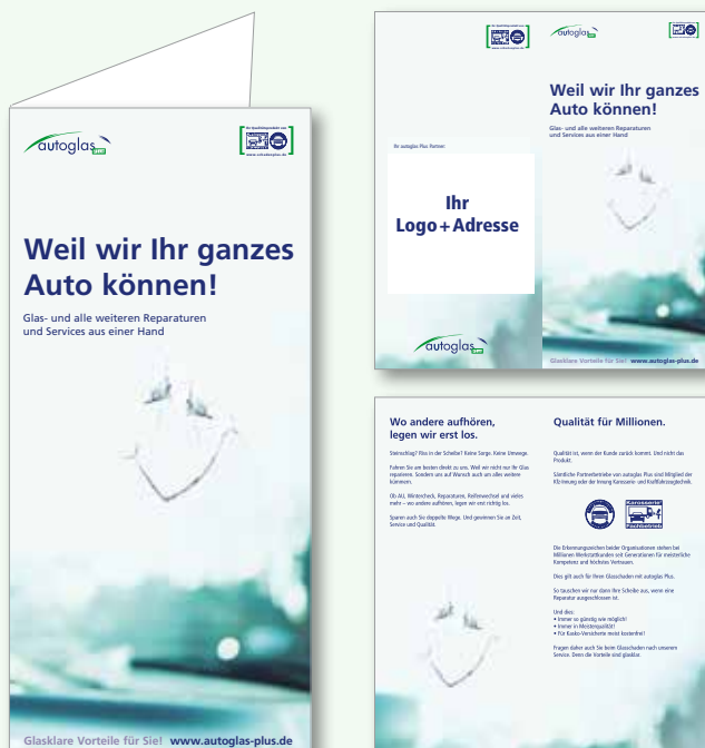
Design: autoglas Plus Klassik