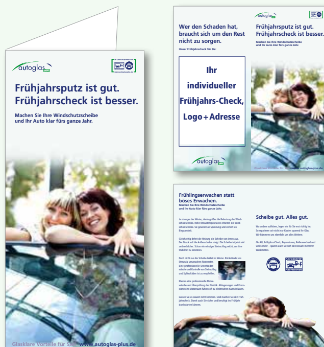
Design: autoglas Plus Frühling