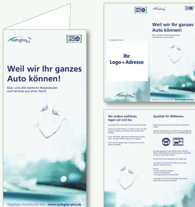
Design: autoglas Plus Klassik

Postwurfsendung... für viele Werbetreibende ein großer Wurf.