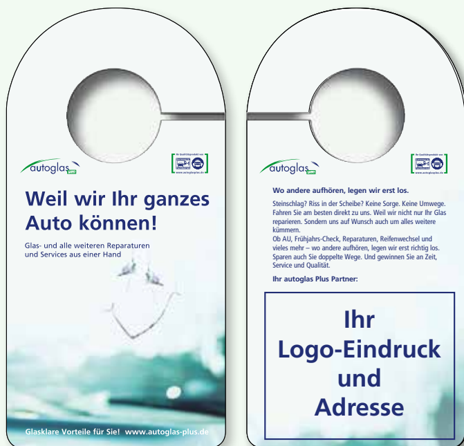
Design: autoglas Plus Klassik