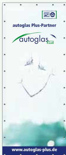
autoglas Plus Design 1