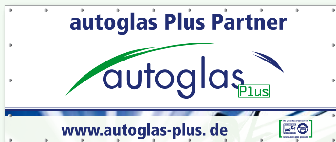
autoglas Plus Design 1