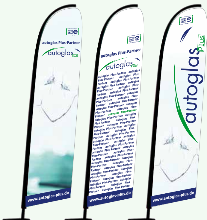
autoglas Plus Design 1 autoglas Plus Design 2 autoglas Plus Design 3