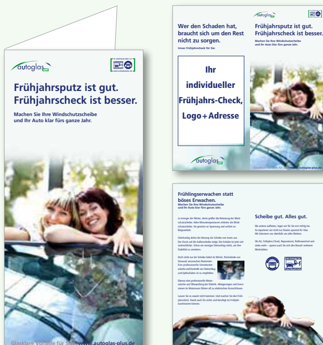
Design: autoglas Plus Frühling

Informativ, plausibel, ansprechend – mit Ihrem Kunden-Flyer von autoglas Plus leisten Sie wichtige Überzeugungsarbeit und sparen sich selbst viele Worte. Hochwertig gestaltet und mit Ihrer Adresse und Ihrem Logo ausgestattet, eignet sich der Flyer nicht nur zur Vermarktung am POS, sondern zugleich als Basis-Instrument zum erfolgreichen Direktmarketing.