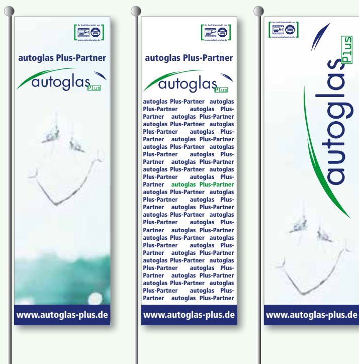
autoglas Plus Design 1